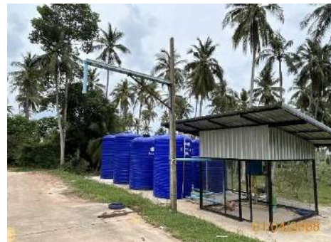
ภาพที่ 2.2-11 บ่อบาดาลใช้ประโยชน์ในบริเวณหน้าท่า และรดน้ำต้นไม้