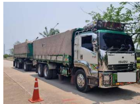
ภาพที่ 2.2-14 การปิดคลุมกระบะท้ายรถบรรทุกด้วยผ้าใบและรัดตรึงสินค้า