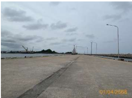
ภาพที่ 2.2-10 พื้นที่กองสินค้าเทกอง