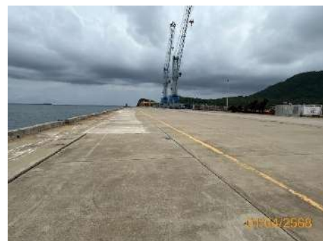
ภาพที่ 2.2-2 บริเวณพื้นที่ท่าเรือ