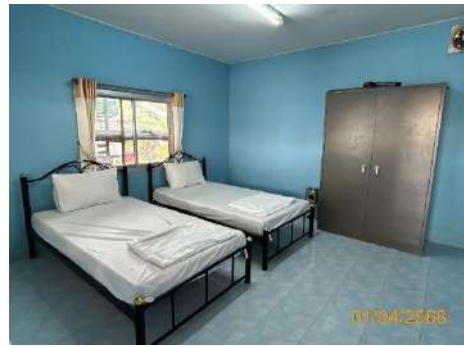
ภาพที่ 2.2-43 ห้องปฐมพยาบาล