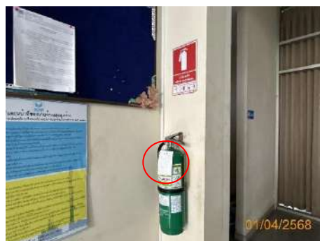
ภาพที่ 2.2-41 การตรวจสอบสภาพอุปกรณ์ดับเพลิงโดยบริษัทผู้จำหน่าย