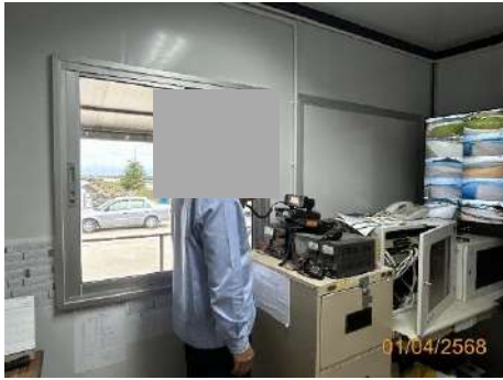
ภาพที่ 2.2-31 ระบบวิทยุสื่อสาร