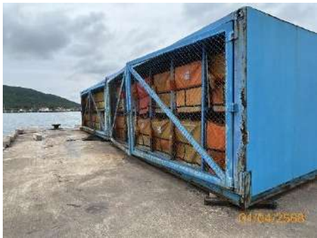
ภาพที่ 2.2-6 ตู้กักน้ำมัน