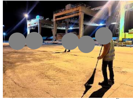
ภาพที่ 2.2-5 การเก็บกวาดทำความสะอาดพื้นที่ท่าเรือ หลังขนถ่ายสินค้า