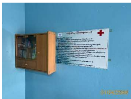
ภาพที่ 2.2-42 ตู้ยาสามัญประจำบ้าน