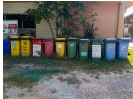
ภาพที่ 2.2-7 ถังขยะภายในโครงการ แยกประเภท