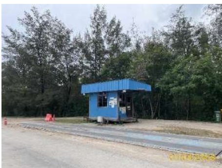
ภาพที่ 2.2-29 พื้นที่ซังน้ำหนักรถบรรทุก