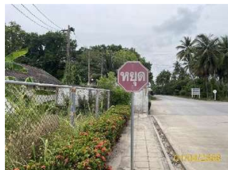
ภาพที่ 2.2-20 ป้ายสัญลักษณ์จราจร