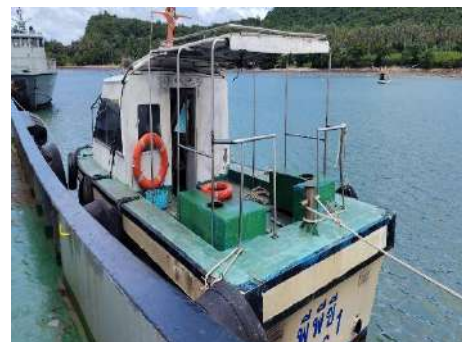
ภาพที่ 2.2-36 เรือเร็ว