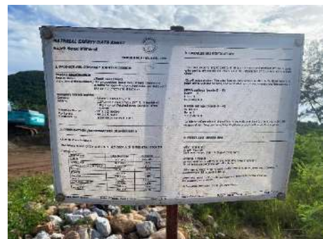
ภาพที่ 2.2-39 ป้ายบ่งบอกสินค้า สถานะของการปฏิบัติงาน และขอบเขตพื้นที่ในขณะปฏิบัติงาน