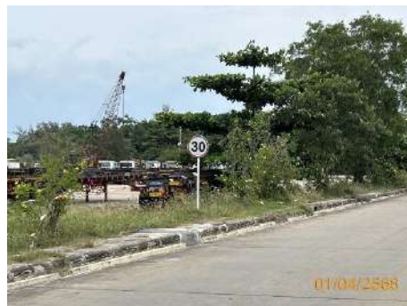
ภาพที่ 2.2-19 ป้ายจำกัดความเร็ว