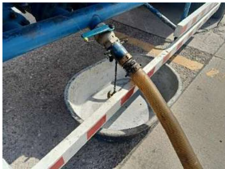
ภาพที่ 2.2-8 ถาดรองน้ำมันบริเวณข้อต่อ