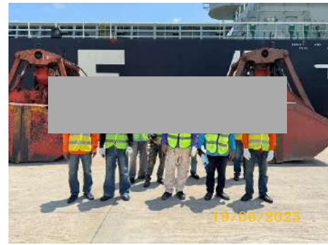
ภาพที่ 2.2-12 พนักงานใส่อุปกรณ์ป้องกันอันตรายส่วนบุคคล