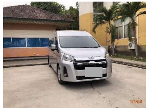
ภาพที่ 2.2-44 รถรับส่งผู้ป่วยไปสถานพยาบาล