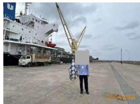
ภาพที่ 2.2-30 พนักงานควบคุมการจราจร ประจำท่าเทียบเรือ