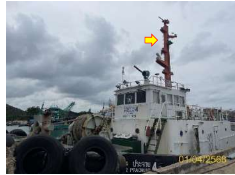
ภาพที่ 2.2-37 เรือดับเพลิง