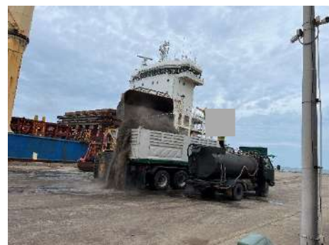
ภาพที่ 2.2-15 การปิดคลุมกองสินค้า/การฉีดพรมน้ำ