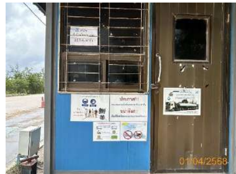
ภาพที่ 2.2-38 ป้ายบอก/ป้ายเตือน