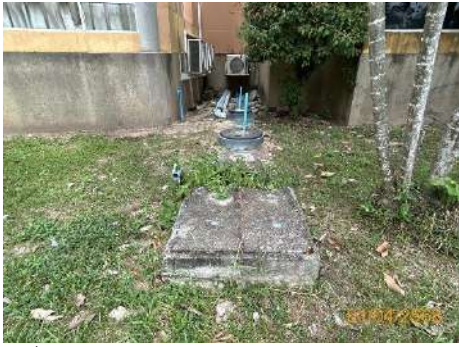
ภาพที่ 2.2-4 บ่อเกรอะ-บ่อซึม และถังกรองไร้อากาศ ที่อาคารปฏิบัติงาน