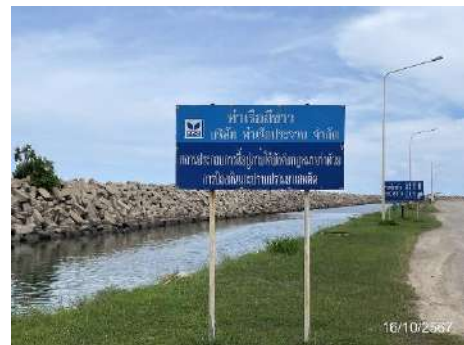
ภาพที่ 2.2-28 ป้ายแสดงเขตพื้นที่ท่าเรือ