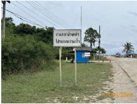
ภาพที่ 2.2-21 ป้ายเตือนลดความเร็ว บริเวณทางรวิ่งเข้า-ออกโครงการ