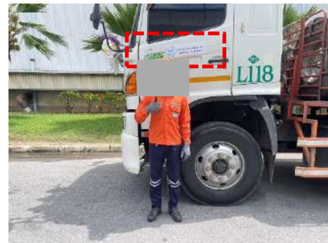
ภาพที่ 2.2-26 ป้ายแสดงหมายเลขโทรศัพท์ที่รถบรรทุก