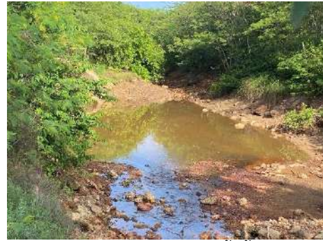
ภาพที่ 2.2-17 บ่อพักน้ำทิ้ง