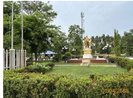
ภาพที่ 2.2-1 พื้นที่สีเขียว