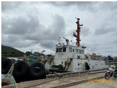
ภาพที่ 2.2-33 เรือ Tug