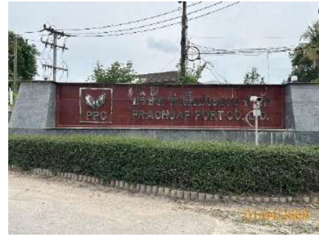
ภาพที่ 2.2-22 ป้ายชื่อหน้าโครงการ