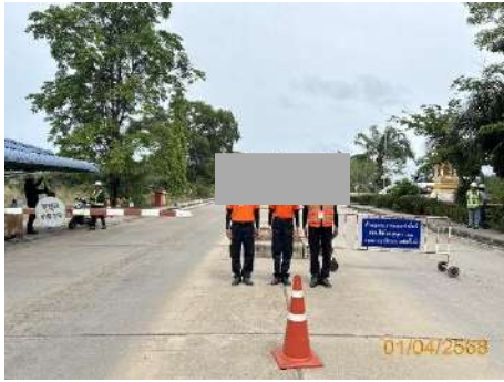
ภาพที่ 2.2-24 ป้อมยามรักษาการณ์