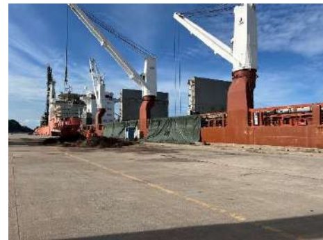
ภาพที่ 2.2-9 การชิงผ้าใบระหว่างเรือสินค้ากับหน้าท่า