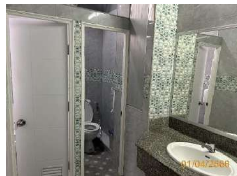
ภาพที่ 2.2-3 ห้องน้ำที่อาคารปฏิบัติงาน