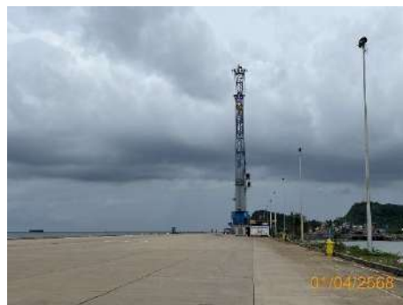
ภาพที่ 2.2-35 Mobile Crane