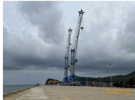
ภาพที่ 2.2-18 ปั่นจั่น/เครนบนท่า