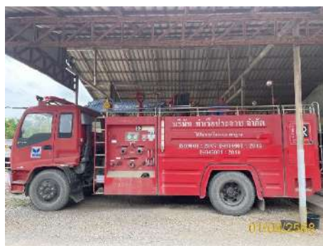
รถดับเพลิง