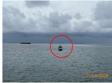
ภาพที่ 2.2-32 ทุ่นสัญญาณไฟนำร่อง