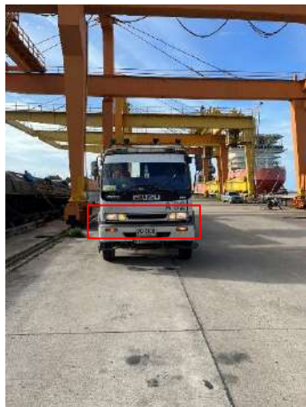
ภาพที่ 2.2-27 สัญญาณไฟกระพริบของรถบรรทุก