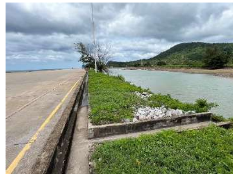
ภาพที่ 2.2-34 ระบบรางระบายน้ำจากกิจกรรมล้างทำ ความสะอาดพื้นที่ท่าเรือ