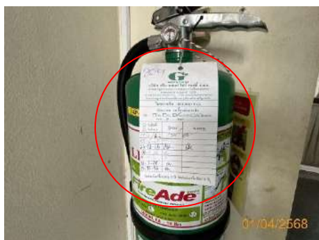
ภาพที่ 2.2-40 อุปกรณ์ป้องกันและระงับอัคคีภัย