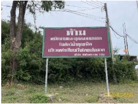
ภาพที่ 2.2-16 ป้ายห้ามจับสัตว์น้ำ